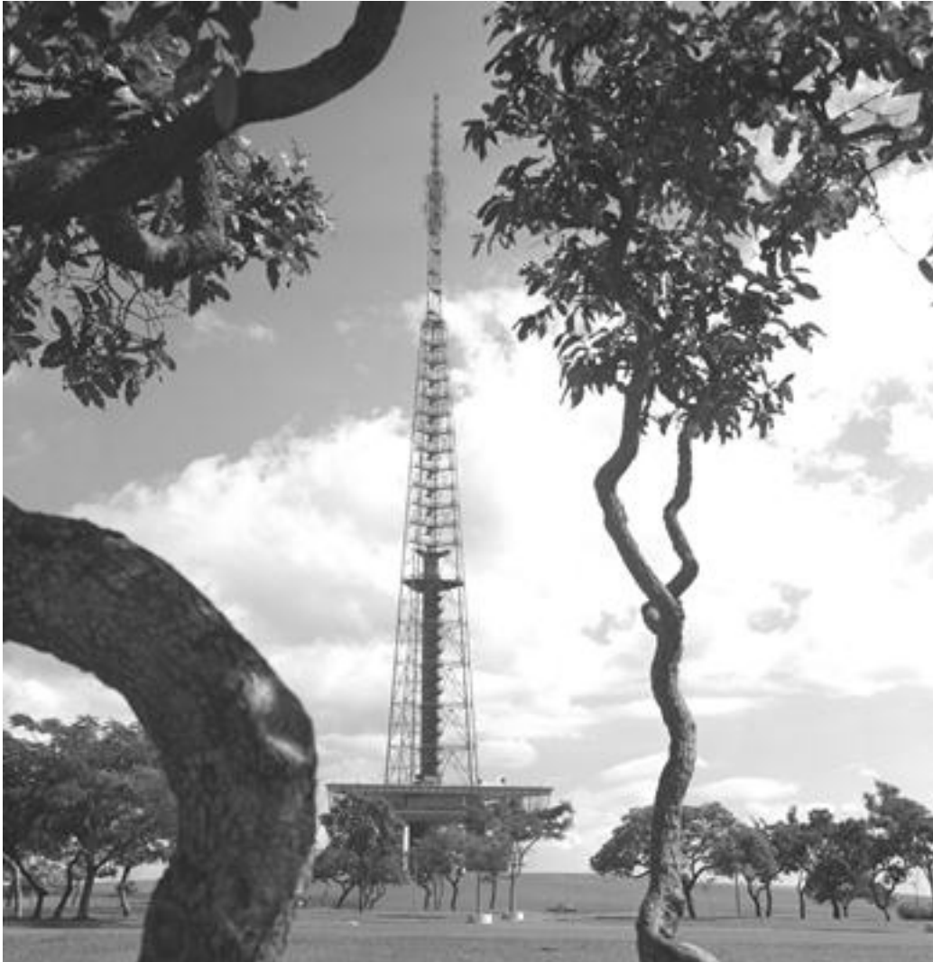
Torre de TV de Brasília

A torre para transmissões dos sinais das redes de televisão, com 224 metros de altura, abrigou, em sua base, a tradicional feira de artesanato, hoje localizada em espaço adequado a poucos metros dali. Do mirante localizado aos 75 metros, tem-se uma bela vista da Esplanada dos Ministérios, das Asas Sul e Norte e até mesmo do Lago Paranoá. Um conjunto de fontes de água completa a área de descanso e lazer muito frequentada pelos moradores da cidade e pelos visitantes de Brasília.